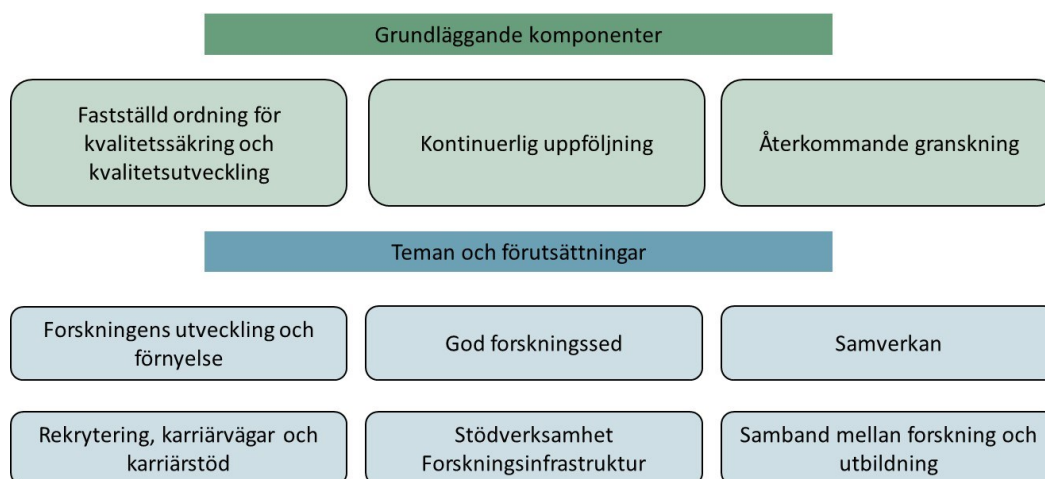
Figur 1. Schematisk bild över SUHF:s ramverk för kvalitetssäkring och kvalitetsutveckling av forskning

Framtagande av UKÄ:s vägledning gjordes i dialog med högskolesektorn, och Sveriges universitet och högskolors förbund (SUHF) erbjöds att ta fram lärosätessammansamma riktlinjer för lärosätenas kvalitetssäkring och kvalitetsutveckling av forskning. SUHF:s förbunds församling antog 2019-03-13 ett Gemensamt ramverk för lärosätenas kvalitetssäkring och kvalitetsutveckling av forskning . Ramverket omfattar grundläggande komponenter samt teman och förutsättningar för forskningen (figur 1). Bland annat anger ramverket att lärosätena ska ha en fastställd och allmänt tillgänglig ordning för kvalitetssäkring och kvalitetsutveckling av forskningen. Exempel på komponenten återkommande granskning är kvalitetsutvärderingen av forskning vid Lunds universitet, där den senast genomförda utvärderingen benämndes RQ20.